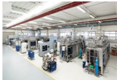
Foto 2: Produzione di apparecchi per l'industria farmaceutica presso lo stabilimento di Riese Pio X