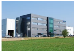
Photo 6: Lo stabilimento Belimed di Grosuplje