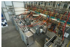
Foto 8: Controllo qualità sugli sterilizzatori Belimed prima della consegna ai clienti