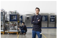
Foto 5: Applicazioni mediche per il controllo delle infezioni in ambito ospedaliero, presso lo stabilimento produttivo Steelco di Riese Pio X