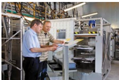
Foto 7: Prodotti per il settore farmaceutico e i laboratori di Belimed